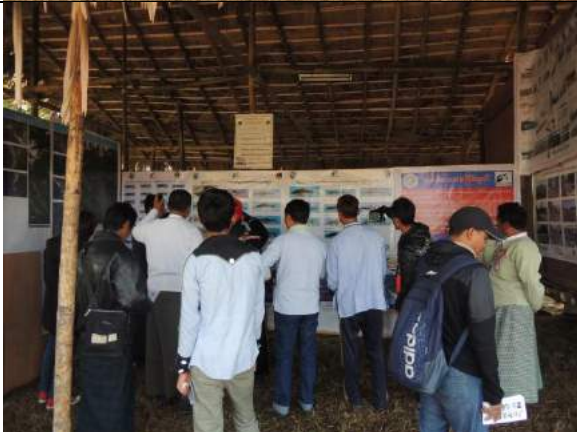
Exhibit awareness on fisheries in the Lisu ethnic festival. (February 2018)