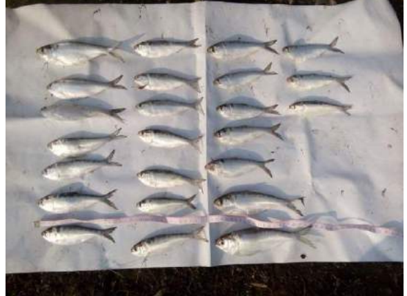
Fish landing monitoring together with the Department of Fisheries in Indawgyi. (Mar 2018)