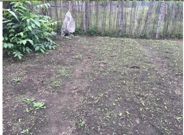
Monitoring small grant activities and provision of new commodity seedlings for seasonal vegetable plantation for home gardening as small grants to the project villages. (May 2018)