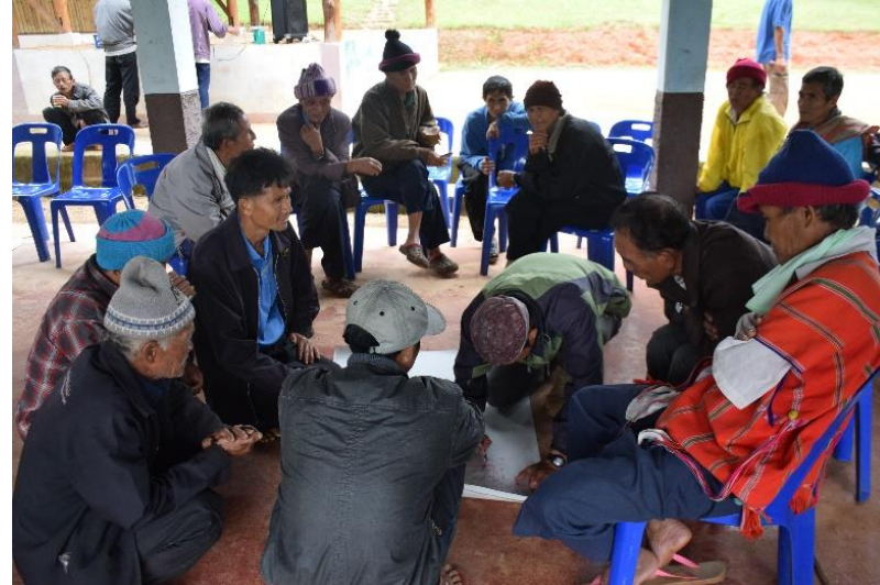
Community Mapping exercises by villagers.