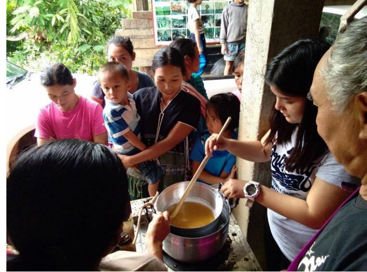
Soap Making activity conducted by women.