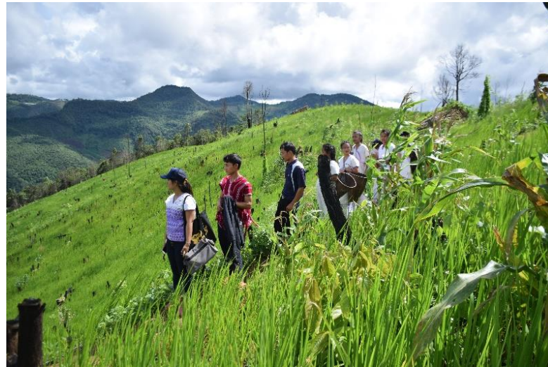
Collection of vegetables from Rotational Farming areas.